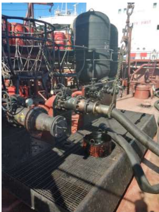
Манифольды левого борта.