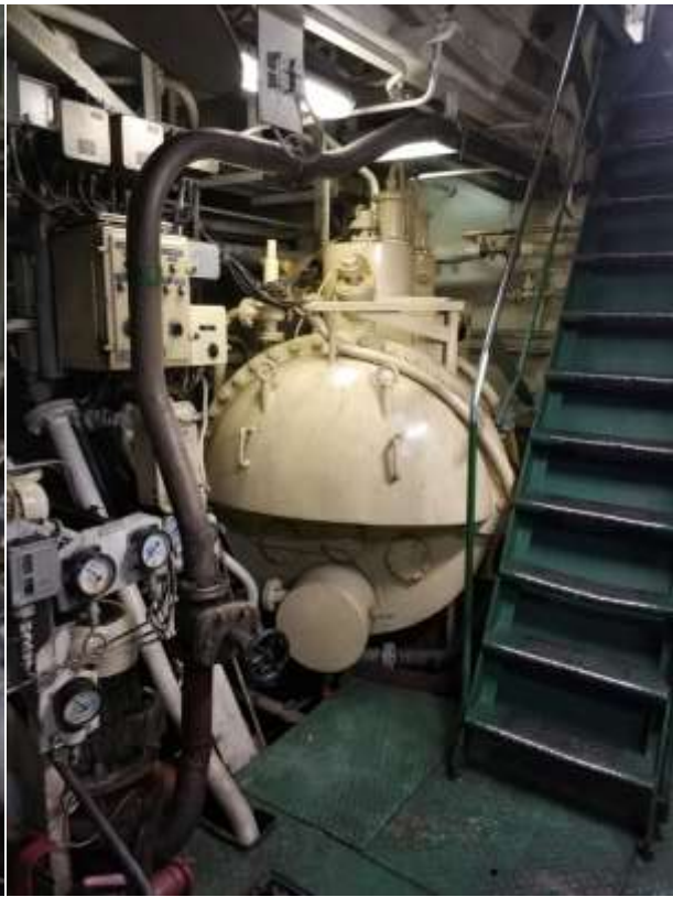
ЦПУ машинного отделения.